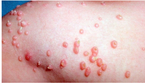
Figura 5. Lesiones por Molusco contagioso (Tomado de Fundación mexicana para la dermatología A.C. Molusco contagioso [Internet]. Molusco Contagioso - in Enfermedades de la piel & prevención - Infecciones de Transmisión Sexual (ITS), 2017 )