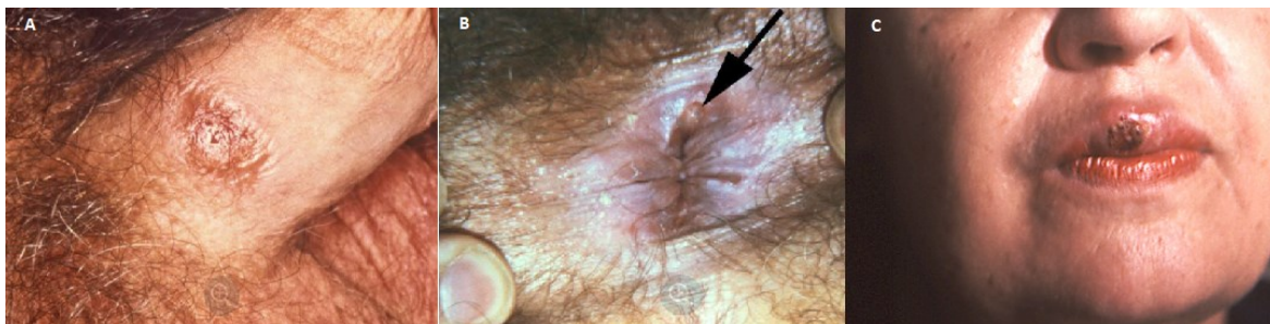
Figura 1. Sífilis primaria A: Chancro genital, B: Chancro anal, C: Chancro bucal

Sífilis secundaria: De 2 a 12 semanas luego del contagio se presentan manifestaciones más generalizadas siendo estas mucocutáneas y parenquimatosa con eritema que puede ser papular, macular o pustuloso a esta fase se la conoce como secundaria o estadio diseminado. (figura2).