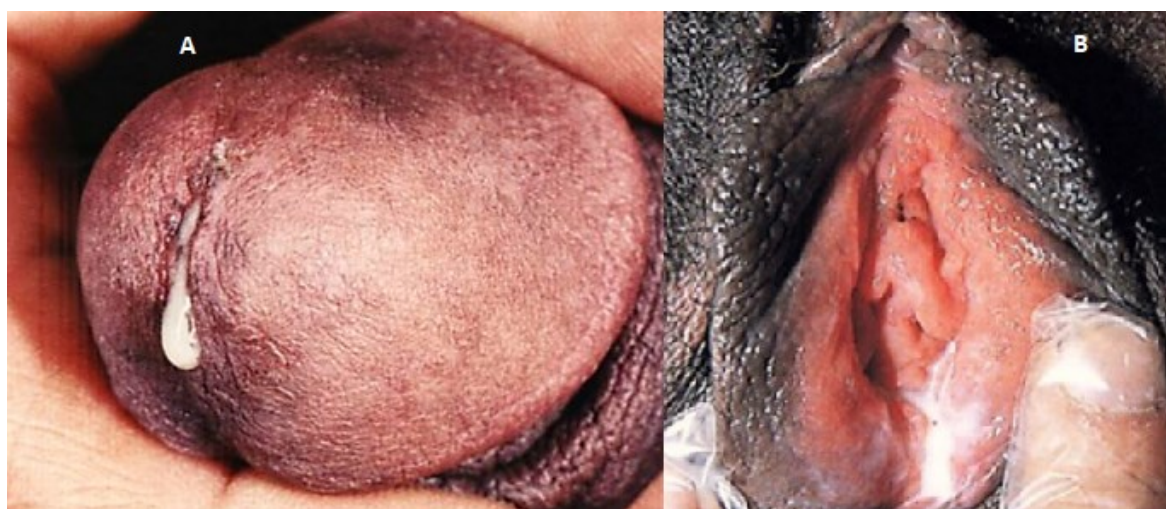
Figura 3. A: Uretritis gonocócica sintomática con escasa secreción uretral. B: Gonorrea uretral en mujer, la secreción purulenta es visible, sin compromiso de la glándula de Bartolino (Tomado de Ramírez Moya AA, Sociedad Peruana de Dermatología. Gonorrea, infectocontagiosa, venérea. 2019;29(3):167-75)

La Uretritis se presenta en el 90% de los pacientes y es sintomática, su período de incubación es de 2 a 8 días pudiendo llegar hasta los 14 días, El inicio se produce con secreción uretral, puede ser escasa o mucoide, pero luego se hace purulenta en el 80% de los hombres infectados en menos de 24h de haber iniciado los síntomas, se presenta además disuria y si se afecta la uretra posterior puede existir tenesmo, dolor uretral, hematuria terminal, en el examen físico además del exudado (figura 3), puede existir edema del meato uretral y eritema, en no circuncidados se puede observar balanitis. Para poder evidenciar la secreción es preferible que hayan pasado al menos 2h desde la última micción, incluso es indicación para la toma de muestras (15).