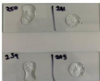
Figura 2. Imágenes tomadas durante la ejecución del ensayo de catalasa para Staphylococcus aureus . Revelando un resultado positivo.

En el análisis de la presencia de Staphylococcus aureus en muestras de carne de res del mercado 9 de Octubre de Cuenca, se obtuvo como resultado la positividad para coagulasa y catalasa. De acuerdo con los criterios de aceptación establecidos por la Normativa INEN 1338:2012, los resultados no cumplen con los estándares aceptables, ya que muestran un crecimiento del 100% para coagulasa y 100% para catalasa en las 30 muestras analizadas (Tabla 2).