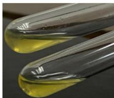
Figura 3. Imágenes tomadas durante la ejecución del ensayo de catalasa positiva para Staphylococcus aureus . Revelando un resultado positivo.