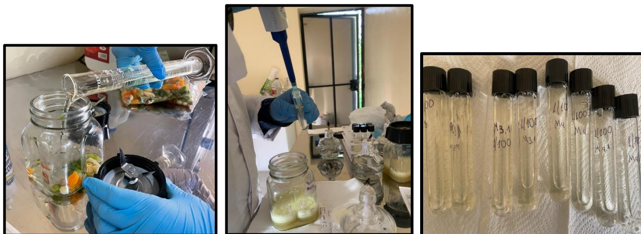
Fig.a: Preparación de la dilución madre o primera dilución (1/10) con agua de peptona; Fig.b: Preparación de la segunda dilución (1/100); Fig.c: Diluciones preparadas listas para ser sembradas en las placas COMPACT DRY EC.