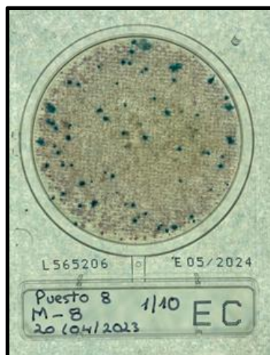
Fig. 6 Crecimiento bacteriano de E. coli ; en placas COMPACT DRY EC

Crecimiento de colonias de E. coli con una coloración azul en los medios de cultivo