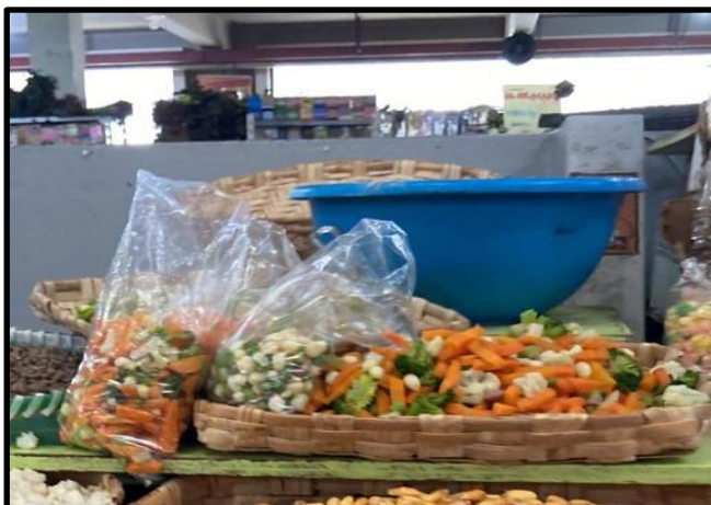
Fig. 1 Uno de los puestos de expendio de las ensaladas cocidas